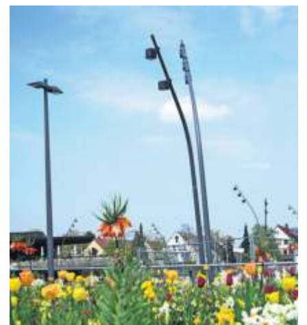
Die alte Beleuchtung (li.) wird durch 27 Doppelmasten ersetzt.

Der erste Bauabschnitt des insgesamt knapp 600 000 Euro teuren Beleuchtungskonzeptes wird in den kommenden Tagen abgeschlossen. Nach dem Fellbacher Herbst stellen die Stadtwerke dann weitere 23 Doppelmasten im Bereich der Tainer Straße nördlich der U-Bahnlinie auf.