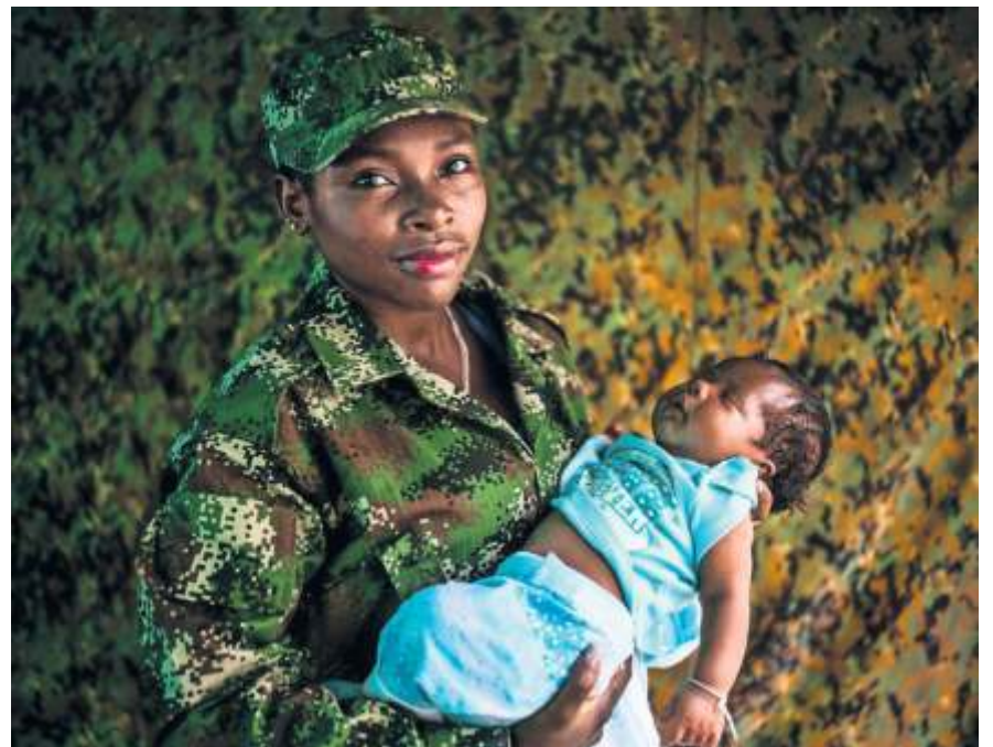
Von Federico Rios stammen die Fotos der preisgekrönten Reportage.

Eine Ausstellung zum Hansel-Mieth-Preis mit den preisgekrönten und weiteren Reportagen ist vom 2. bis 11. Mai im oberen Foyer des Fellbacher Rathauses zu sehen. Der Eintritt ist frei. Die Preisträger veranstalten zudem einen Workshop mit der Schülerzeitung des Gustav-Stresemann-Gymnasiums in Schmiden und berichten von ihrer Arbeit und ihrem Werdegang.