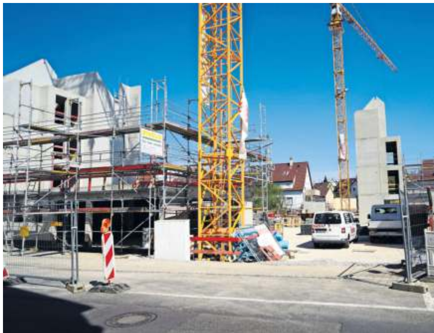
Die Treppenhäuser und Fahrstuhlkerne aus Beton stehen bereits.

Die vorgefertigten Holzbauteile werden von der Firma Weizenegger hergestellt und dann auf Bedarf per Tieflader nach Schmiden transportiert. Die ersten Wandteile erwartet der Montagetrupp in der Woche nach Ostern. Der Bau beginnt mit Haus A, an der Fellbacher Straße. In wenigen Wochen wird das erste Holzhaus rund um den brandsicheren Betonkern in die Höhe wachsen. Nach Fertigstellung des ersten Rohbaus beginnen dann die Arbeiten am nächsten Gebäude.