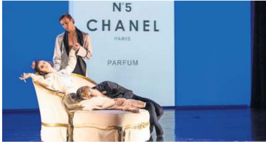
„Mythos Coco“ bringt die Geschichte Coco Chanel auf die Bühne.

Im großen gemischten Abonnement A/B lassen die Berlin Comedian Harmonists mit ihrem neuen Programm „Über den Wolken“ den Klang ihrer unvergessenen Vorbilder wiederaufleben und bieten sowohl Evergreens der 1920er und 1930er Jahre als auch Interpretationen neuerer Songs. Der mitreißende Musiktheaterabend „Elvis, Comeback!“ legt das Augenmerk auf die späte Phase des King of Rock'n'Roll, gemäß dem Motto: Die Legende lebt! Eine anspruchsvolle Choreographie und versierte Schauspielkunst sind im Ballett „Mythos Coco“ des Breuer Balletts Salzburg / Euro-