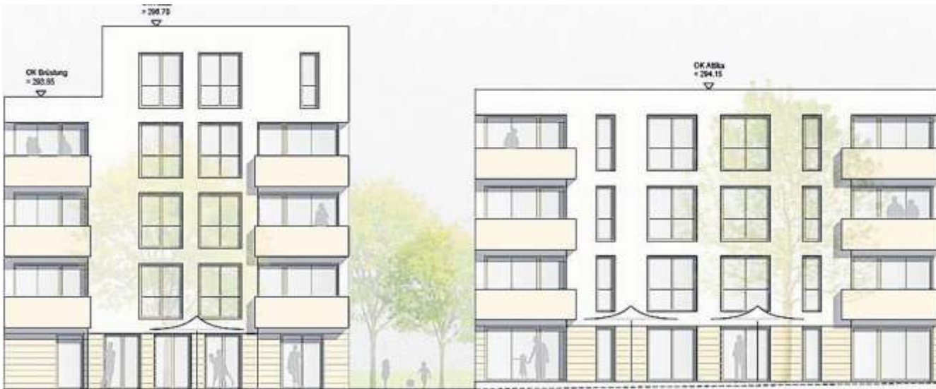
Drei Wohngebäude wird das Siedlungswerk im Baugebiet Esslinger Weg I errichten.

Am 1. Mai startet auch die 40. Pfalaho der Oeffinger Pfadfinder. Los geht's auf der Festwiese am Hartwald um 10.30 Uhr mit einem Jugendgottesdienst. Anschließend ist Familientag. Für die Musik sorgt der MV Oeffingen. Am Donnerstag pausiert die Pfalaho. Weiter geht es am Freitag, 3. Mai. Ab 17 Uhr ist das Festgelände bewirtet. Die Musik an diesem Tag kommt von La Diri. Auch am Samstag, 4. Mai, beginnt die Bewirtung um 17 Uhr. An diesem Tag spielen die Bring It Home Boys. Mit einem Familientag endet die Pfalaho am Sonntag, 5. Mai. Das Festgelände ist an diesem Tag ab 11 Uhr bewirtet.