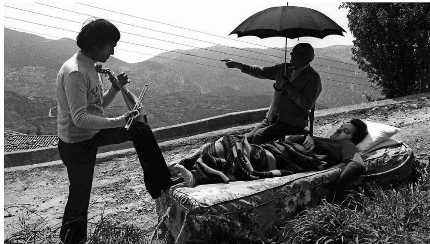
Die Galerie der Stadt Fellbach zeigt Fotografien aus Griechenland des Magnum-Fotografen Nikos Economopoulos.

Die Ausstellung in der Galerie der Stadt Fellbach, Marktplatz 4, ist zu sehen von 1. Juni bis 10. September. Öffnungszeiten sind Dienstag bis Donnerstag von 16 bis 19 Uhr, Freitag bis Sonntag von 14 bis 18 Uhr. Der Eintritt ist frei.