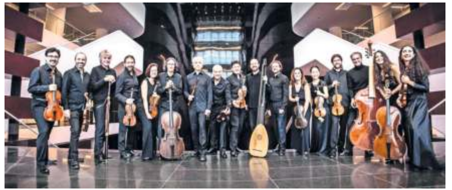
Il Giardino Armonico spielt in der Lutherkirche.