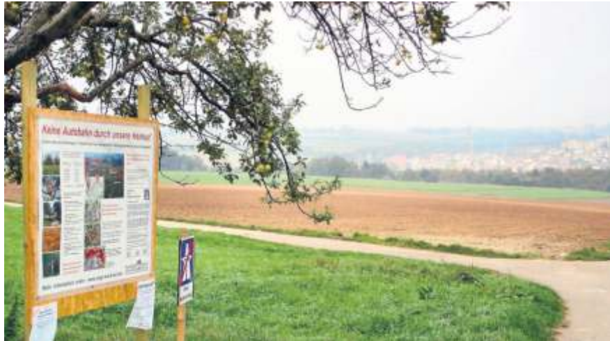
Dem Nord-Ost-Ring würden wertvolle landwirtschaftliche Flächen und Naturräume zum Opfer fallen.

Die erneute Aufnahme eines Teilstücks für einen möglichen Nord-Ost-Ring in den Bundesverkehrswegeplan sowie der Beschluss des baden-württembergischen Kabinetts, diese Verkehrsverbindung in dem „Luftreinhalteplan Stuttgart“ aufzulisten, hatten in den vergangenen Wochen für Gesprächsstoff und lebhaft Debatten in der Region und im Fellbacher Gemeinderat gesorgt. Zwar hatte Oberbürgermeisterin Zull nicht von einem direkten Planungsauftrag des Landes für den Nord-Ost-Ring gesprochen, doch vor dem Bau der mehrspurigen