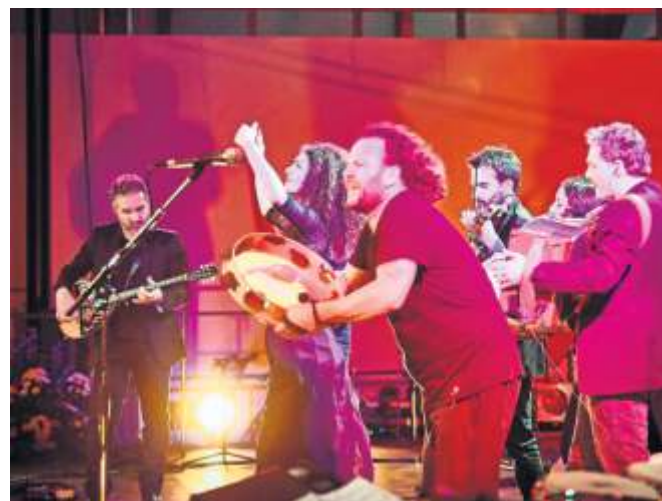
Aus Süditalien: Canzoniere Grecanico Salentino