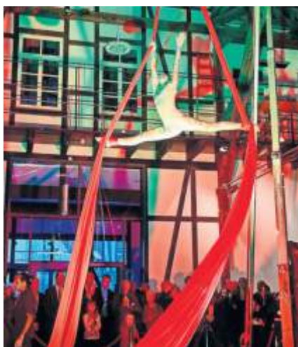
Akrobatik unterm Fachwerkdach zeigte Sinakt.