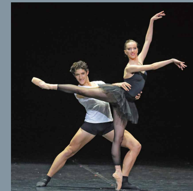
Bayerisches Junior Ballett München