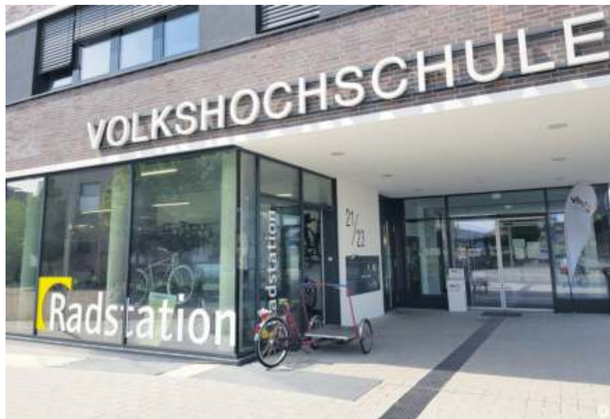
Die Radstation blickt auf fünf erfolgreiche Jahre zurück.

Das Jubiläum wird am Montag, 18. September, nachmittags von 16 bis 18 Uhr gefeiert. Die Stabsstelle Radmobilität verteilt an der Radstation „Goodies“ für Radfahrer und Fußgänger. Von 13 bis 18.30 Uhr werden an der Radstation zusätzlich kostenlose Radchecks angeboten. Durchgeführt werden die kostenlosen Rad-Sicherheitschecks in bewährter Weise vom Team „Radolino“ aus Heidelberg. Bürger können ihr Fahrrad hier auf Sicherheit und Fahrtauglichkeit