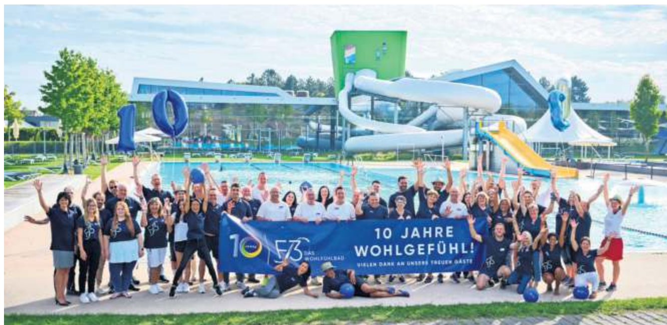
Das Team vom F3 freut sich aufs Jubiläumswochenende.

Alle Aktionen sind im regulären Eintrittspreis enthalten.