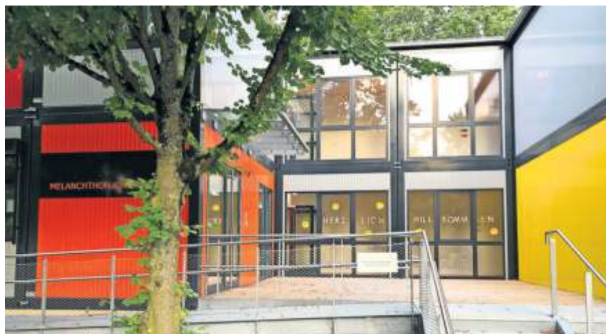
Die Interims-Kita auf dem P3.

Insgesamt investierte die Stadt Fellbach rund 3 Millionen Euro in die Erweiterung der Interims-Anlagen auf dem P3-Areal, die jetzt der neue Kindergarten von sechs Kita-Gruppen und über 100 Kindern ist.