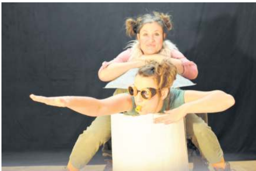
Eine philosophische Geschichte für Kinder ab vier Jahren erzählt „Der Bär, der nicht da war“.