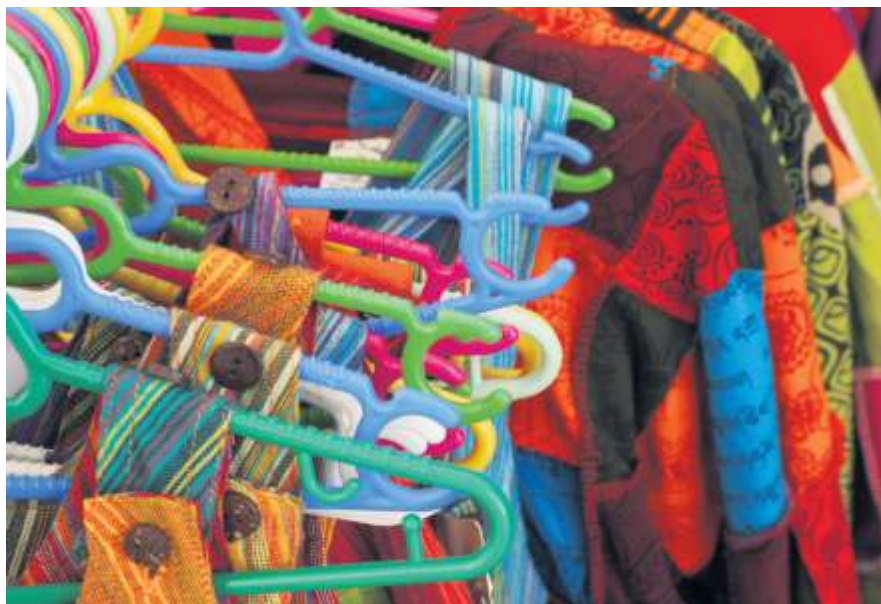
Tausch und Plausch ist das Motto bei der Kleidertauschaktion.