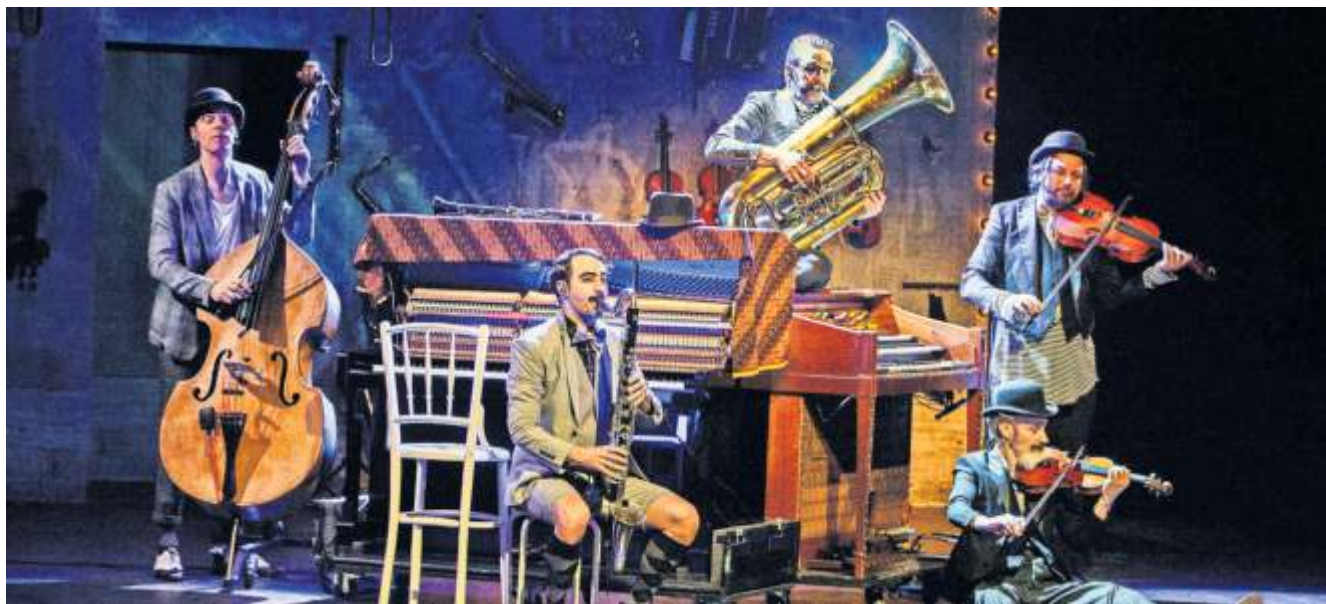
Zum Auftakt der Theaterspielzeit 2023/24 gibt es Musik.Comedy.