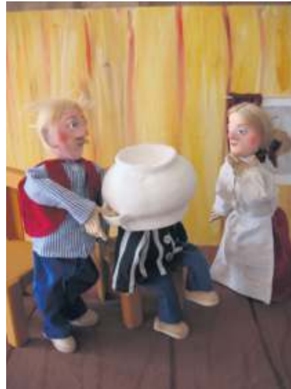
Michel aus Lönneberga kommt als Puppenspiel.

Zum Abschluss des Jahres wird am Freitag, 15. Dezember, um 16 Uhr „Weihnachten bei Shakespeare“ im Stadtteil- und Familienzentrum Fellbach mit dem Figurentheater Himmelreicher aus Karlsbad und allen Kindern ab vier Jahren gefeiert. Es beginnt mit Sturm auf dem Dachboden – viel Lärm um nichts? Von wegen! Mäuserich Shakespeare wehrt sich widerspenstig gegen das Weihnachtsfest. Er lebt allein auf dem Dachboden in einer seltsamen, leicht verschrobene Theaterwelt, am liebsten ungestört. Maus Lilli hat also alle Hände voll zu tun, um Shakespeare in Weihnachtsstimmung zu versetzen – und Kater „Richard III.“, seit langer Zeit auf der Jagd nach Shakespeare, trägt seinen Teil dazu bei! Am Schluss aber ist, frei nach dem echten Shakespeare, „Ende gut, alles gut“!