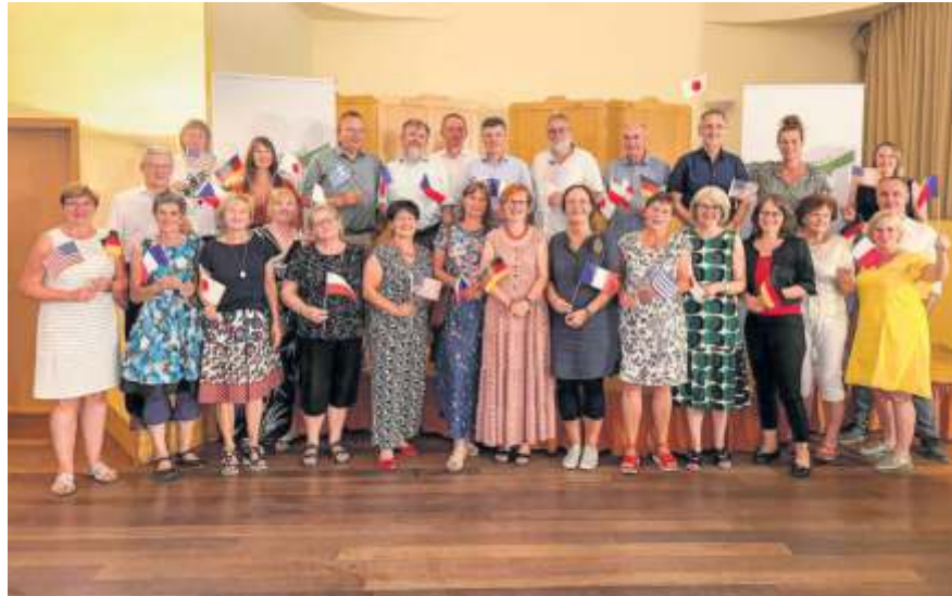
Mit Freunden aus den Partnerstädten feierte der Städtepartnerschaftsverein Meißen sein 25-jähriges Bestehen.

Ein Abendessen mit Freunden aus Arita (Japan), Leitmeritz (Tschechien)