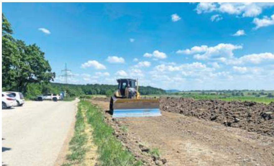
Die Vorbereitungen fürs Bodenmanagement laufen.