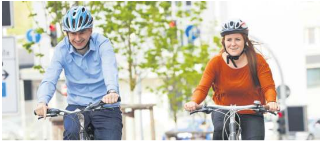
Über die Planungen zum stadtverträglichen Radschnellweg informiert die Stadtverwaltung am 20. Juni im Rathaus.

träglichen Lösung ausgebaut werden“, sind sich die Fachleute einig. Stadtverträglich heißt in diesem Zusammenhang, dass die Breite des Radweges bei 2,50 Meter liegt, ein Schutzstreifen zwei Meter umfasst, die nicht zurückgebaute Fahrspur der alten B14 mitgenutzt wird und dass die Wegführung zusammen mit den Bürgern, den Einzelhänd-