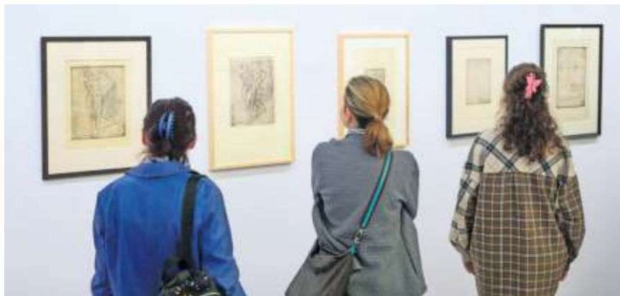
Bis 6. August sind die Arbeiten Wilhelm Lehmbrucks zu sehen.