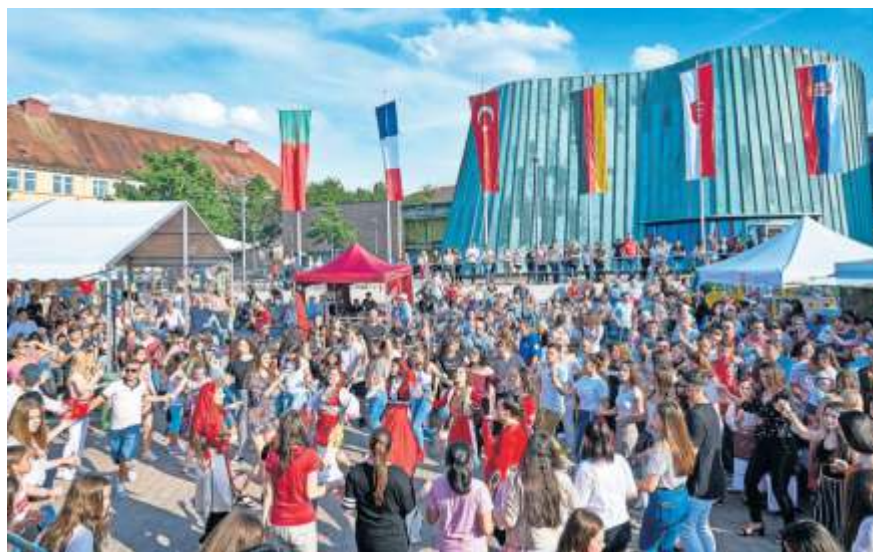
Treffpunkt der Kulturen – die Fiesta International.

Das Bühnenprogramm am Samstag ist geprägt von Tänzen und Klängen des „Pasiön Flamenca“ aus Spanien, dem Konzertprogramm des Handharmonika-Club Fellbach e.V. mit dem Städtepartnerschaftsverein