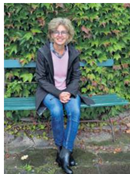
Sophie von Bechtolsheim

ligt, wurde 1943 zum Oberstleutnant befördert und am nordafrikanischen Kriegsschauplatz unter Rommel schwer verwundet. Er verlor eine Hand. Zunächst hatte er die Ernennung Hitlers zum Reichskanzler 1933 begrüßt und fühlte sich dann als Offizier an seinen Treueid gebunden. Erst als der verbrecherische Charakter des Nazi-Regimes immer deutlicher zutage trat und angesichts der drohenden militärischen Niederlage entschloss er sich, der Widerstandsbewegung beizutreten und wurde zur zentralen Persönlichkeit des militärischen Widerstands innerhalb der Wehrmacht. Am 20. Juli 1944 ließ er im „Führerhauptquartier“ in Ostpreußen eine Bombe detonieren. Nach dem Scheitern des Anschlags wurde Stauffenberg gemeinsam mit seinen Vertrauten Albrecht Mertz von Quirnheim, Friedrich