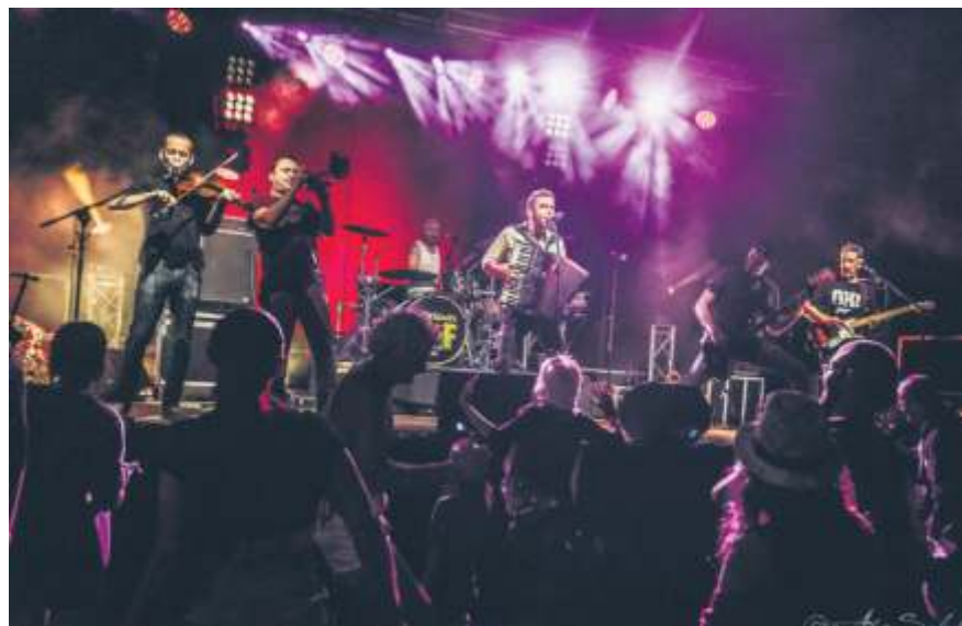
Aus Frankreich kommen Les Barbeaux zur Fête de la Musique.

der Internationale Chor Fellbach im Schaugarten, das Orchester des Handharmonika-Clubs Fellbach vor dem Pavillon auf dem Alten Friedhof und die Spätlese Blasmusik auf dem Museumsvorplatz zu hören. Ebenfalls um 18 Uhr tritt der Sänger Babossa mit HipHop und Rap vor der Zehntscheuer hinter dem Polizeirevier in der Cannstatter Straße auf. Weiter geht es um 18.30 Uhr mit dem Folk- und Blues-Duo Walk Two Folk am Sprudler am Rathaus. Um 18.45 Uhr präsentiert die Band Bildschöner & Wolf vor der Zehntscheuer einen stilvollen Mix aus Gernehörtem und Unerhörtem und das Duo des Handharmonika-Clubs Fellbach spielt im Hof des Weinguts Heid. Um 19 Uhr lohnt ein Besuch beim musikalischen Komiker-Duo WuF (Woody und Flo) im Schaugarten. Freunde der Blasmusik dürfen sich freuen, wenn der Musikverein Lyra Schmiden auf dem Museumsvorplatz aufspielt. Zur selben Zeit ist außerdem die Band Zunder auf dem Schulhof der Wichernschule zu hören. Um 19.30 Uhr erklingen Melodien des Duos des Handharmonika-Clubs auf dem Alten Friedhof und am Sprudler am Rathaus gibt es Country, Bluegrass, Folk und Blues mit der Band Blue Cotton Club. Zur selben Zeit ist der Singer-Songwriter VOLO im Hof des Weinguts Heid zu Gast. Um 19.45 Uhr spielen The Fol-