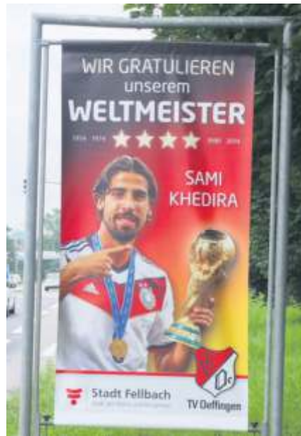
2014 wurde Sami Khedira Fußball-Weltmeister.

Die ersten sportlichen Erfahrungen sammelte Sami Khedira so wie seine Brüder auf dem Tennwengert