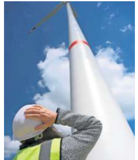
240 Meter hoch ragen die Windkraftträder in den Himmel.

Neben Windkraftanlagen investieren die SWF auch in eine Biogasanlage, in Photovoltaik und in Blockheizkraftwerke. Da in Fellbach die Fläche für große Solaranlagen fehlen, haben die Verantwortlichen früh auf Windkraft gesetzt. Seit dem Jahr 2018 laufen die Vorbereitungen für die Erneuerung der Windkraftträder. Im November 2020 wurde der Antrag beim zuständigen Landratsamt Heidenheim eingereicht und im März 2023 genehmigt. Im Juli wurde