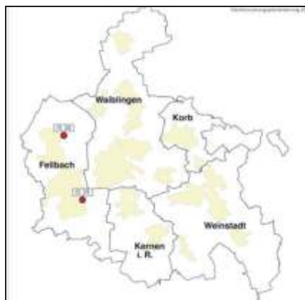
Räumliche Verteilung des Änderungsvorhabens

Die räumliche Verteilung der Änderungsbereiche ist aus dem nachfolgend abgedruckten Kartenausschnitt ersichtlich: