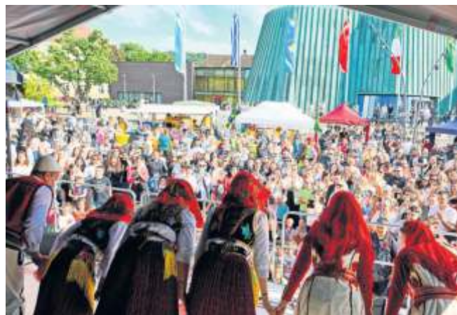
Ob auf der Bühne oder inmitten des Publikums: Das Fiesta-Programm begeisterte.

Die Tradition der Fiesta blickt inzwischen auf 48 Jahre Historie zurück. 1976 luden der Arbeitskreis für ausländische Mitbürger und der Club International erstmals zur Fiesta International ein. Damals noch auf den Vorplatz der Kelter der Fellbacher Weingärtner: „Wir stehen hier für Menschenrechte, Demokratie und Toleranz. Die Fiesta ist keine