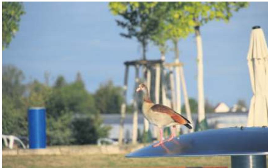
Auch die Nilgans ist eine invasive Art.

Über eine Million Waschbären sind inzwischen in Deutschland heimisch. Vermehrt zieht es die Tiere in den urbanen Raum, da dort die Nahrungssuche einfacher ist. Die marderähnlichen Tiere zerstören Obstbäume, räubern Vogelnester und fressen Amphibien, sie zernagen Dämmungen und siedeln auf Dachböden. Die Tiere mit ihrer typischen weiß-schwarz-grauen Zeichnung sind für viele Hausbesitzer inzwischen eine Plage. Durch ihre Fressvorlieben gefährden die possierlichen Tiere auch die einheimische Tierwelt. Gerade artengeschützte